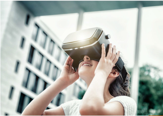
Businesslijn Bebouwde Omgeving