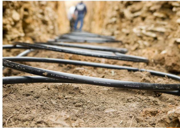
Businesslijn Energie & Ondergrond